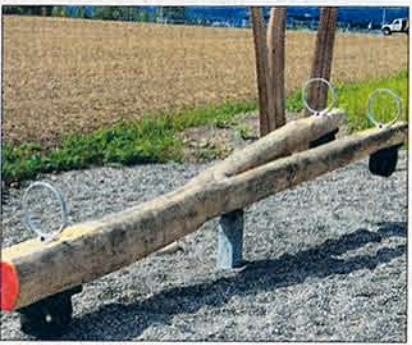
Durchdacht: Wippe mit drei Sitzen.