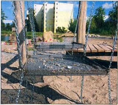
Zum Kiessieben: Gitterbleche.