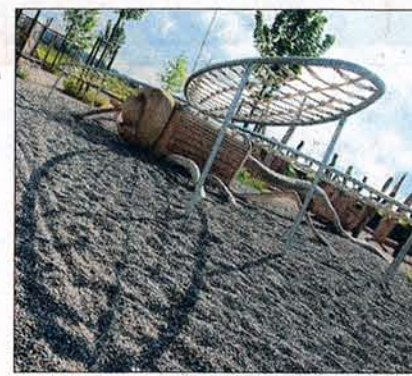
Hebt gleich ab: Libelle.