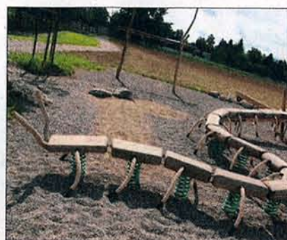
Bitte Füsse zählen: Hundertfüssler.