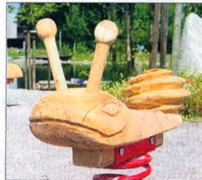
Witzig: Schnecke zum Schaukeln.